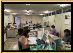
学校給食会事務局