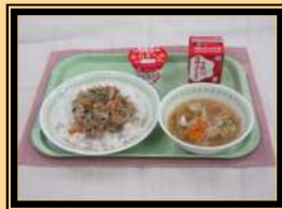
給食の一例（左：自校給食 右：学校給食センター）